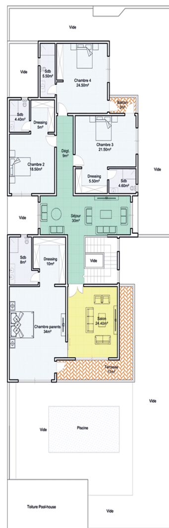
PLAN 1 ER ETAGE